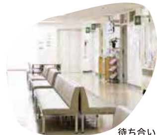
待ち合いスペース