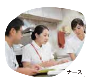
ナースステーション